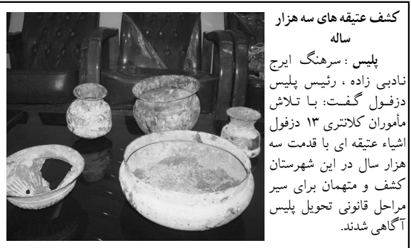
کشف عتیقه های سه هزار ساله