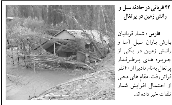
۴۲ قربانی در حادثه سبل و رانش زمین در پرتغال

فارس ، شمار قربانیان بارش باران سیل آسا و رانش زمین در یکی از جزیره‌های پرتغالدر پرتغال به‌نام مادیرا از ۴۰ نفر فراتر رفت. مقام‌های محلی از احتمال افزایش شمار تلفات خبر داده‌اند.