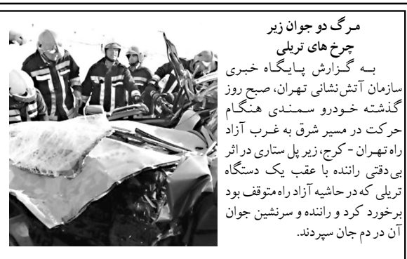
مرگ دو جوان زیر