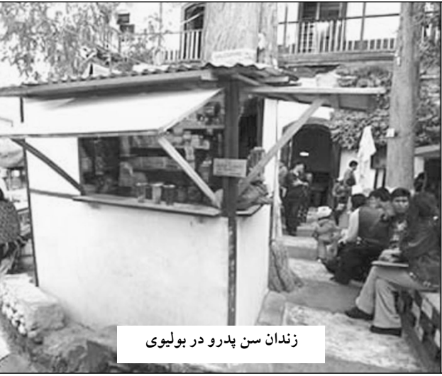
زندان سن پدرو در بولیوی

حذات جنایت کاران، قاچاقچیان هم به تفریح و سرگرمی نیاز دارند! در زندان سبوی با ۱۵۰۰ زندانی به تفریح زندانیان بیش از هر چیز توجه می‌شود. مسئولان این زندان برای اینکه فضای زندان را به محیطی شاد و پویا تبدیل کنند اقدام به تشکیل یک گروه رقص موزیکال با استفاده از خود زندانیان نموده‌اند.