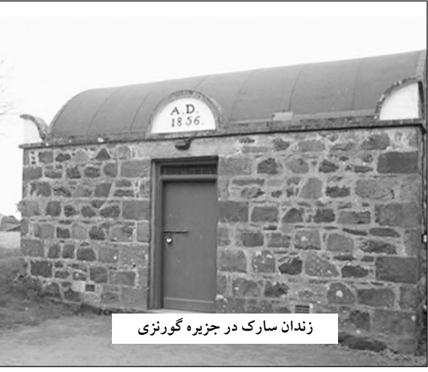
زندان سارک در جزیره گورنزی

هم اکنون این زندان بسته شده است و به یک تفریحگاه تبدیل شده است.