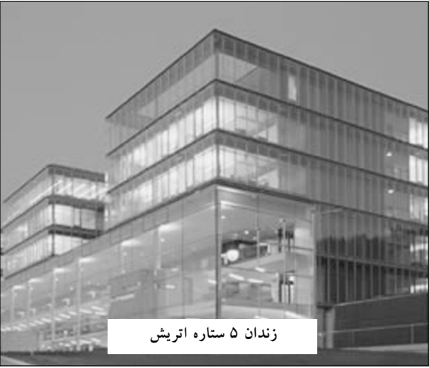
زندان ۵ ستاره اتریش