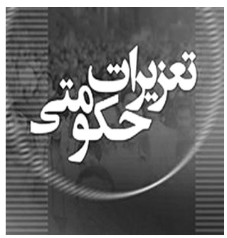
سازمان ثبت اسناد و املاک کشور

تشکیل پرونده برای چند باشگاه ورزشی متخلف از سوی سازمان تعزیرات حکومتی حمایت: سازمان تعزیرات حکومتی برای چند باشگاه ورزشی متخلف در تهران به دلیل اخذ شهریه بیش از تعرفه سازمان تربیت بدنی، پرونده‌هایی تشکیل و به شعب تعزیرات حکومتی ارسال کرد.