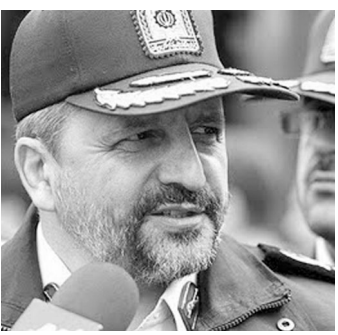
سازمان ثبت اسناد و املاک کشور

پیگیری پرونده پزشکی کهریزک در دستگاه قضایی مهر: سرتیپ اسماعیل احمدی مقدم در مورد پزشکی کهریزک گفت: پرونده فوت مقام های قضائی درحال پیگیری است و تمامی موارد مرتبط با این فرد باید از قاضی پرونده سؤال شود.