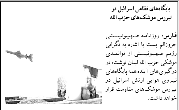
پایگاه‌های نظامی اسرائیل در تیبرس موشک‌های حزب الله

فارس: روزنامه صهیونیستی جروزالم پست با اشاره به نگرانی رژیم صهیونیستی از توانمندی موشکی حزب الله لبنان نوشت: در درگیری‌های آینده همه پایگاه‌های نیروی هوایی ارتش اسرائیل در تیبرس موشک‌های مقاومت قرار خواهد داشت.