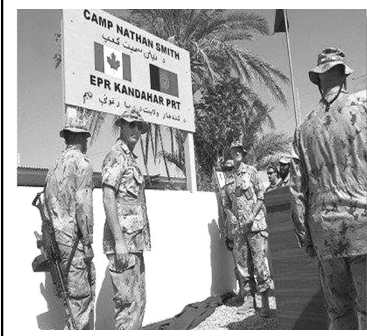
نقض حقوق بشر توسط سربازان کانادایی در افغانستان

ایرنا: درحالیکه کانادا در اقدامی سیاسی و بدون آرایه دلیل و مدرکی ایران را به نقض حقوق بشر متهم می کند، روزنامه گاردین چاپ لندن قاش ساخت که سربازان کانادایی در افغانستان تمامی بازداشت شدگان افغانی را شکنجه کرده اند.