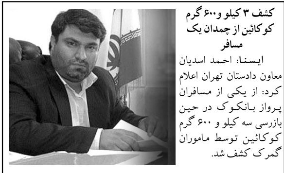
کشف ۳ کیلو و ۶۰۰ گرم کوکائین از جمدان یک مسافر ایسنا: احمد اسدیان معاون دادستان تهران اعلام کرد: از یکی از مسافران پرواز بانکوک در چین بازرسی سه کیلو و ۶۰۰ گرم کوکائین توسط مأموران گمرک کشف شد.