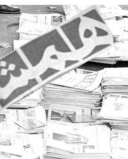
فوق قضائیه دستور رفع توقیف موقت روزنامه همشهری را صادر کرد مهر: دادگستری کل استان تهران توقیف موقت روزنامه همشهری را که عصر دوشنبه توسط معاون مطبوعاتی وزارت فرهنگ و ارشاد اسلامی اعلام شده بود، روز سه شنبه لغو کرد و بدین ترتیب همشهری منعی برای انتشار نداشته و امروز منتشر شد.