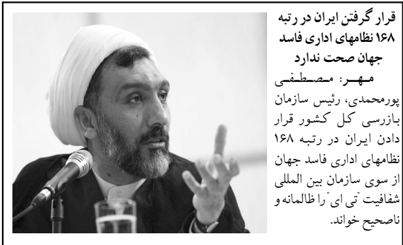
فرار گرفتن ایران در رتبه ۱۶۸ نظامهای اداری فاسد جهان صحت ندارد مهر: مصطفی پورمحمدی، رئیس سازمان بازرسی کل کشور قرار دادن ایران در رتبه ۱۶۸ نظامهای اداری فاسد جهان از سوی سازمان بین المللی شفافیت تی ای را ظالمانه و ناصحیح خواند.