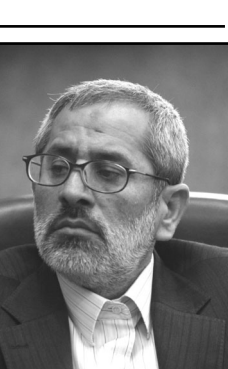
دادستان تهران با بیان این که محاکمه افرادی که فکر می کنند به جاهایی وصل هستند و قدرت دارند هنر قوه قضائیه است، گفت: مسأوی بودن مردم شعار جدی دستگاه قضایی است و همه باید در برابر این دستگاه متواضع حاضر شوند.

باید با اطلاع رسانی بیشتر و با استفاده از همه ظرفیت های رسانه ای و مشارکت متخصصان کشور، ضمن فراهم آوردن زمینه های اجرای این طرح، ابعاد مختلف آن نیز برای